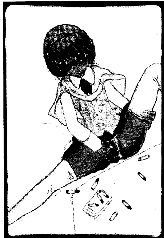
CRAYON, 2004 Acrylic on canvas, 150 x 100mm ©2004 Mahomi Kunikata/Kaikai Kiki Co., Ltd. All Rights Reserved.