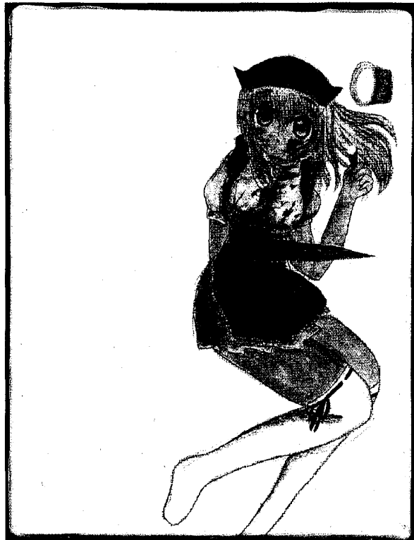
STOMACH SWORD. MAYU-CHAN. 2004

'Otaku is standaard seks tussen man en vrouw, maar vaak ook masturbatie met externe objecten'